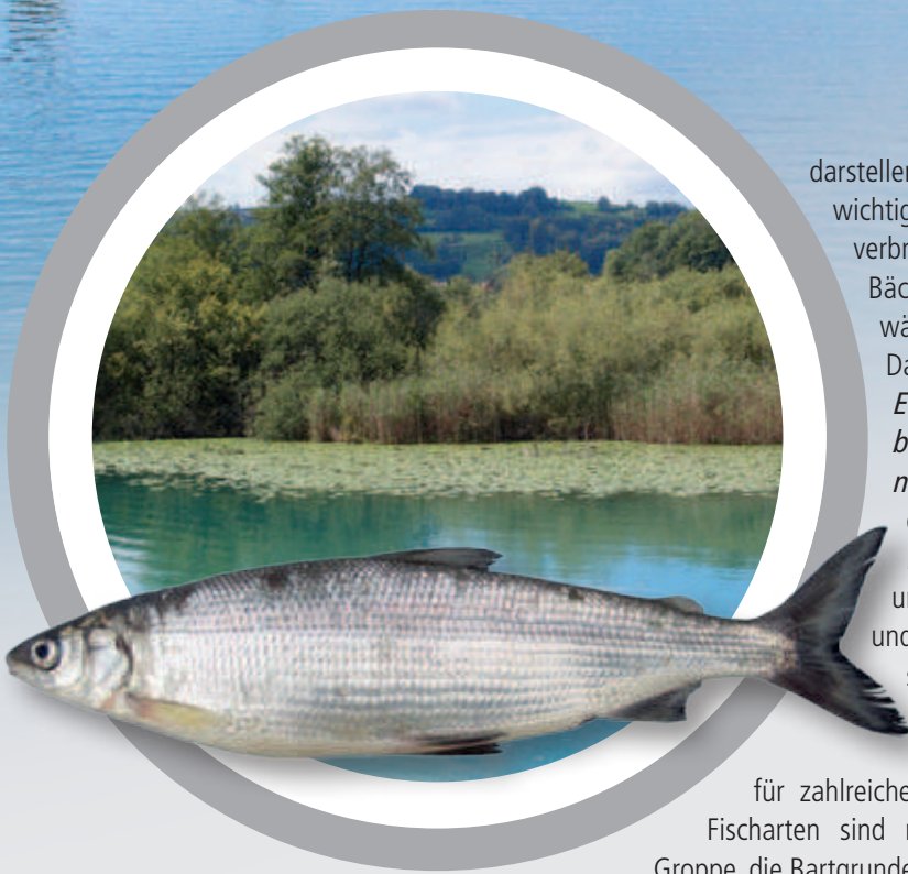
Felchen (lokal auch Ballen genannt) aus dem Hallwilersee. Der Felchenbestand wird in einem Monitoring seit 1980 überwacht.

darstellen, ist die Forelle die wichtigste und am weitesten verbreitete Fischart in den Bächen und kleineren Gewässern.