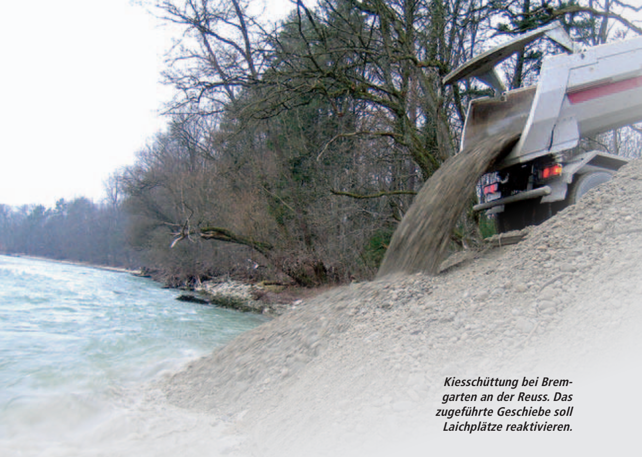
Kiesschüttung bei Bremgarten an der Reuss. Das zugeführte Geschiebe soll Laichplätze reaktivieren.