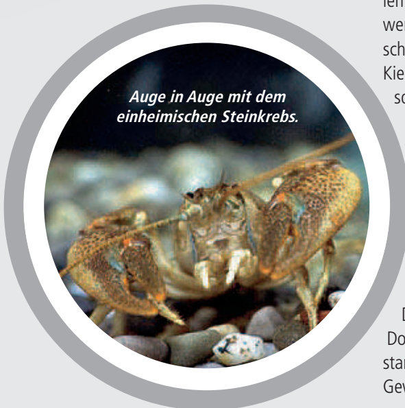
Auge in Auge mit dem einheimischen Steinkrebs.

Die einheimischen Flusskrebarten Stein-, Dohlen- und Edelkreb sind in der Schweiz stark gefährdet. Lebensraumzerstörung und Gewässerverschmutzung haben den Bestän-