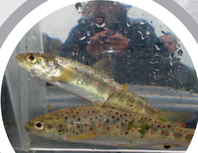
Im Kanton Aargau werden jedes Jahr Junglachse eingesetzt (hinten oben ein Junglachs, im Vordergrund eine Bachforelle).

nicht mehr möglich oder stark beeinträchtigt sind, liegt ein starker Akzent der fischereilichen Hegemassnahmen bei der Erhaltung und Unterstützung des Jungtieraufkommens. Dies kann einerseits mit Lebensraumaufwertungen, aber auch mit dem Einsatz von künstlich aufgezogenen Jungfischen erreicht werden.